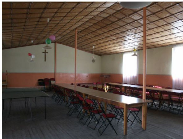
Informacji w Pyzdrach